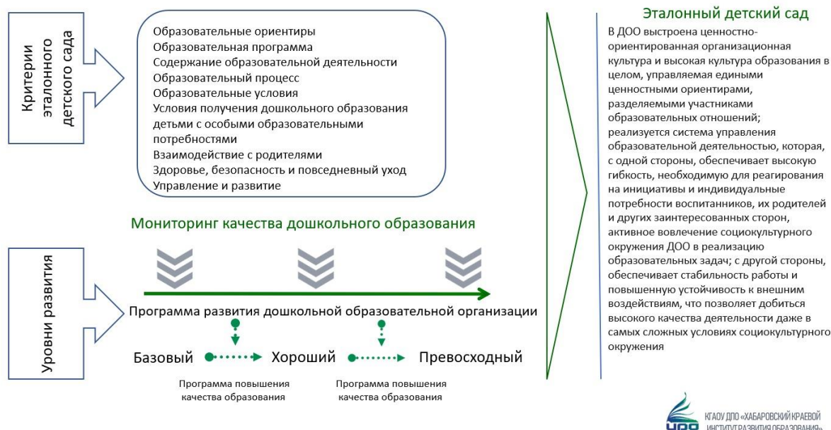
Рисунок 1. Модель эталонного детского сада

Модель эталонного детского сада обеспечивают разностороннюю характеристику образовательной деятельности ДОО и представлена следующими направлениями: